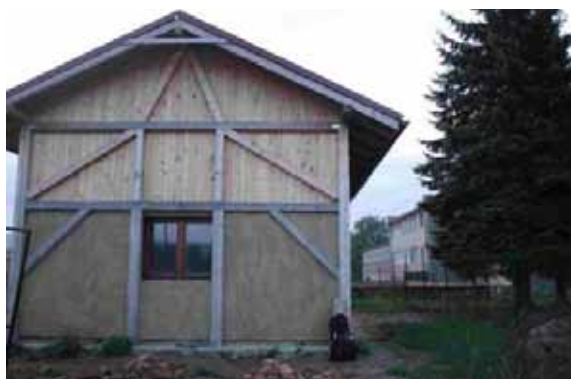
Pohľad na zateplenú a omietnutú budovu Ekocentra SOSNA