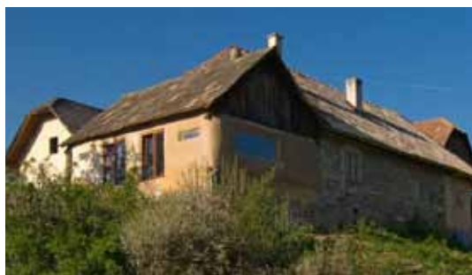
Čajovňa - steny izolované slamenými balíkmi, omietané hlinenou omietkou