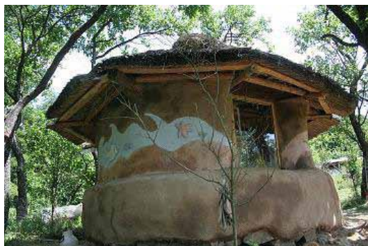
Experimentálny slamený domček s trstinovou strechou a hlinenou podlahou, stabilizovanou ľanovým olejom. Časť prác bola realizovaná v rámci víkendových kurzov.

Zaježka je neformálne spoločenstvo ľudí žijúcich na roztrúsených lazoch Zaježová neďaleko Zvolena.