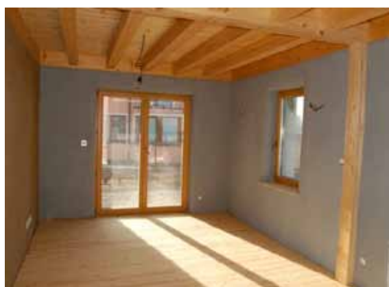
Pasívny dom v Stupave - farebné dekoratívne hlinené omietky.