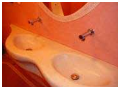
Marocký štuk v kúpeľni.