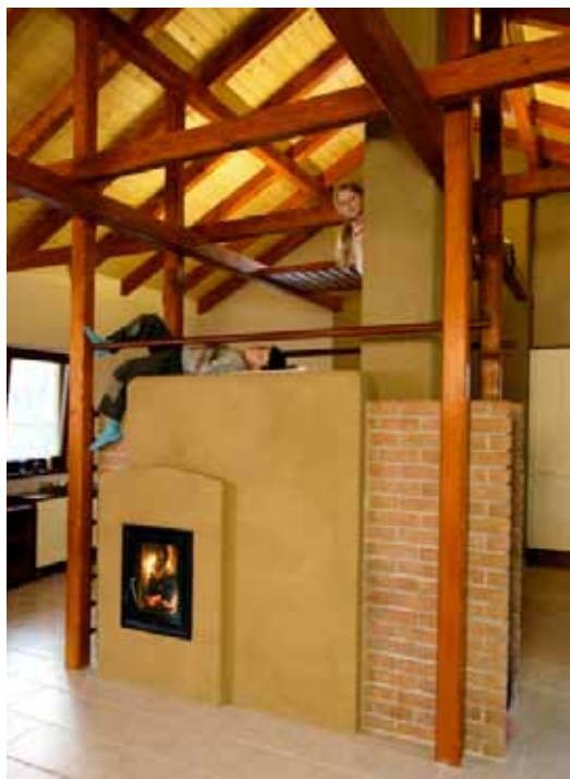
Projekt bungalovu v Limbachu. Hlinené omietky na stenách aj na akumuláčnej peci.