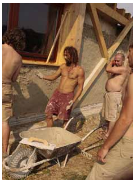
Majster ukazuje dobrovoľníkom, ako sa nanáša hlinená omietka.