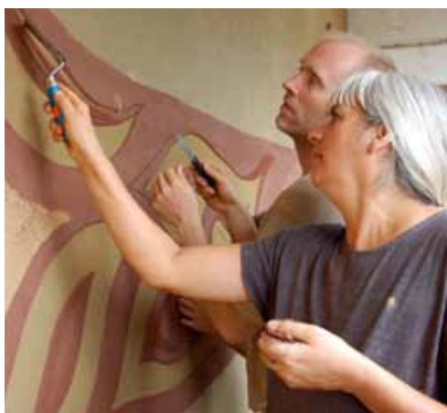
„Workshop“ so Steenovými - tvorba plošného sgraffita v Bučanoch