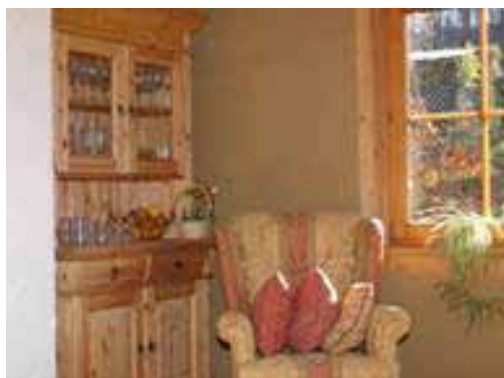
Hlinené omietky v interiéri.