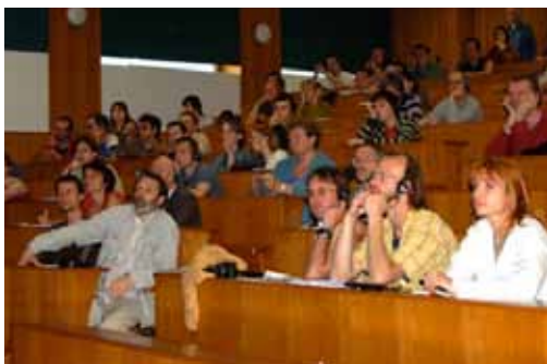
Vzdelávanie - medzinárodná konferencia