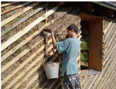
Stavba ekodomčka pre aktivity s deťmi.