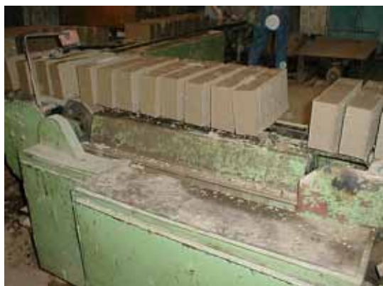
„Krájanie“ surových tehál.

Po uložení na regále sa tehly odvezú do sušiarne, kde sa z tehly odparí približne 15% jej hmotnosti. Tehly sa sušia buď atmosferickým vzduchom, alebo zohrievaným horúcim vzduchom za chladného počasia.