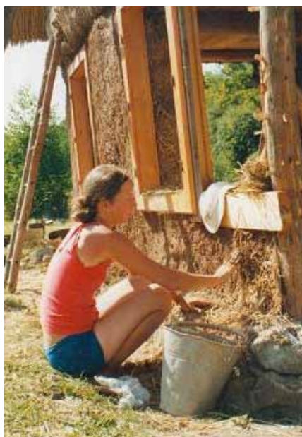
Letná škola prírodného staviteľstva - „workshop“ na omietanie slamenej steny hlinenou omietkou.